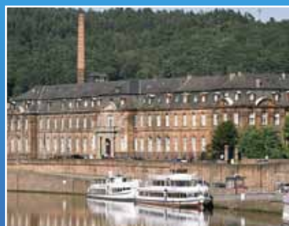
Villeroy&Boch Mettlach: Fachplanung Energiezentrale