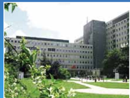
Klinikum Saarbrücken: Fachplanung Gebäudeautomation