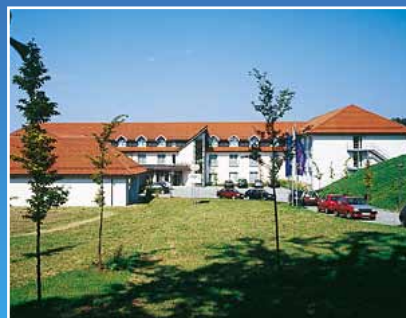
Victor's Hotel Teistungen: Fachplanung Blockheizkraftwerk