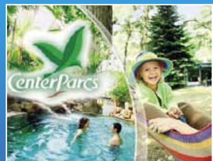
CenterParcs Bostalsee: Fachplanung TGA Heizzentrale mit BHKW