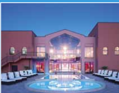
Saarland Therme: Planung, Bau und Betrieb Heizzentrale mit BHKW