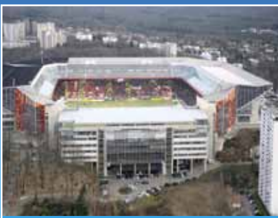
Fritz-Walter-Stadion Kaiserslautern: Ausbau zum WM-Stadion